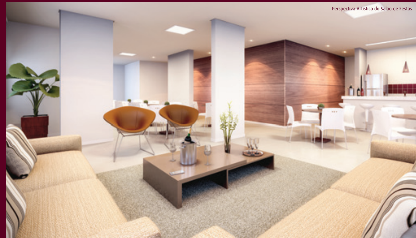
Perspectiva Artística do Salão de Festas

Para você e seus amigos, lazer e conforto.