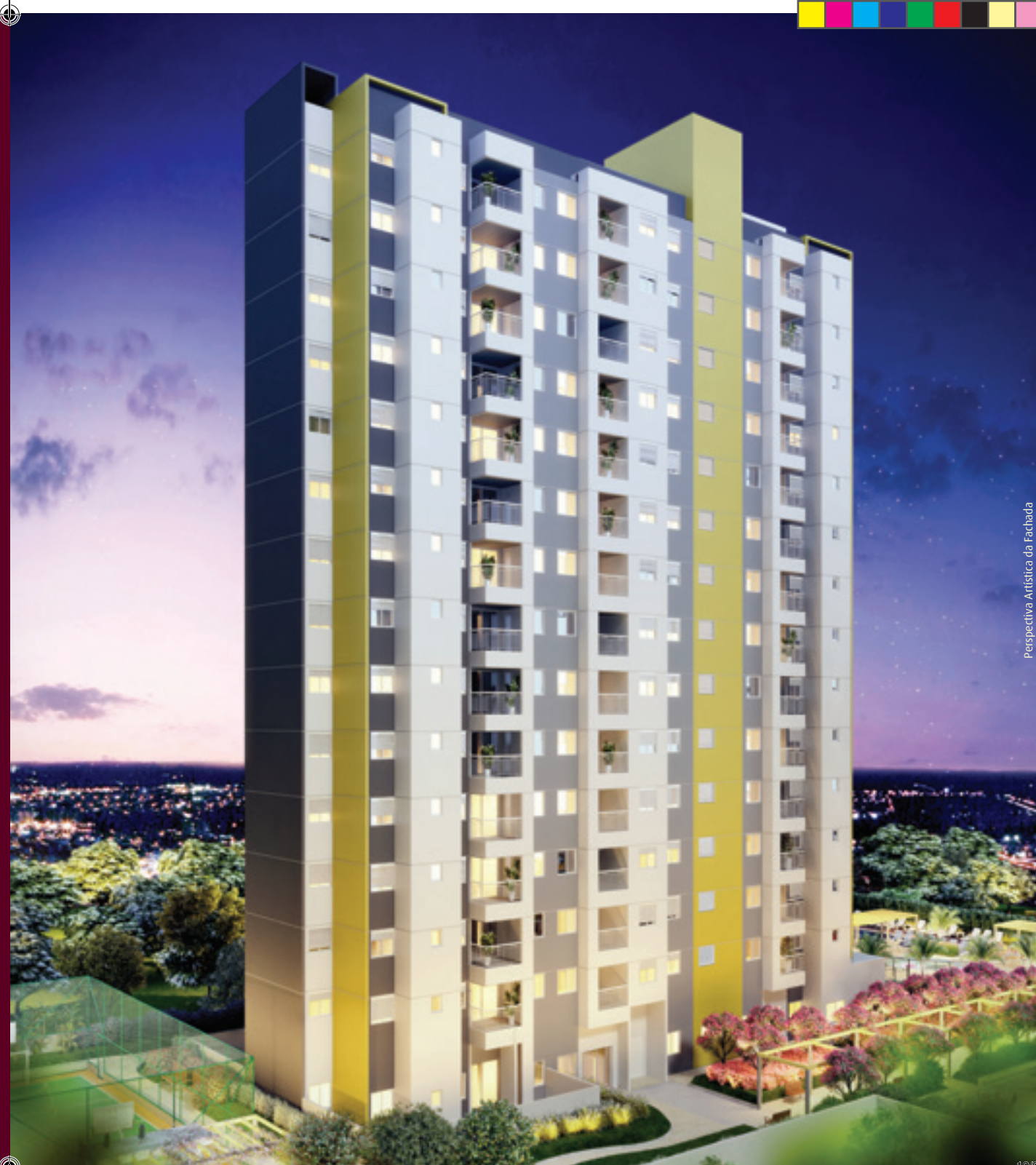
Perspectiva Artística da Fachada