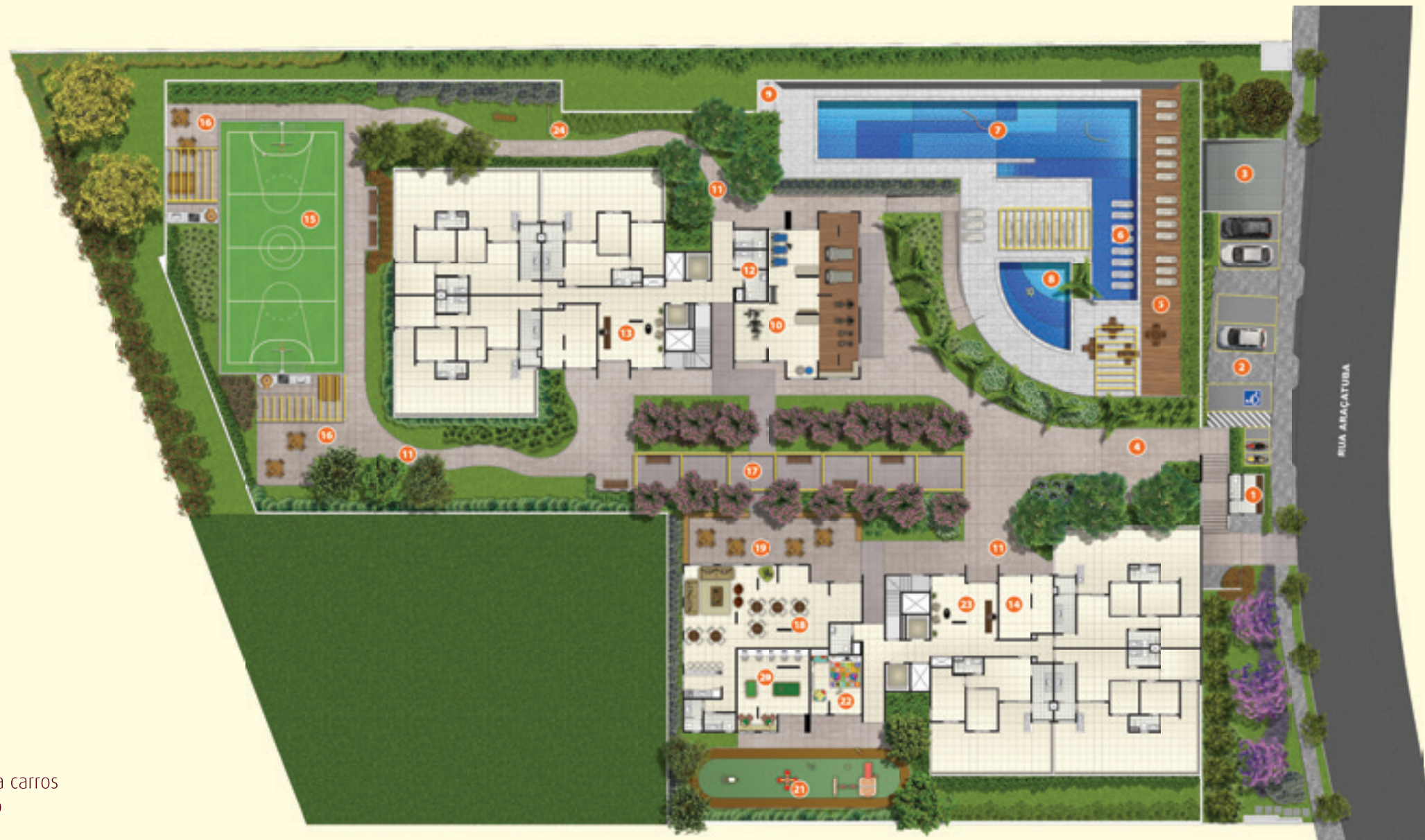
Perspectiva Artística da Implantação