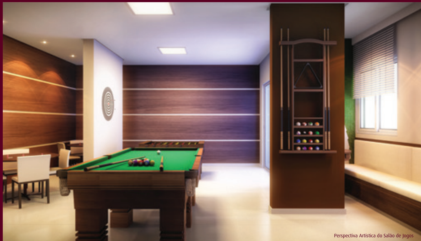
Perspectiva Artística do Salão de Jogos